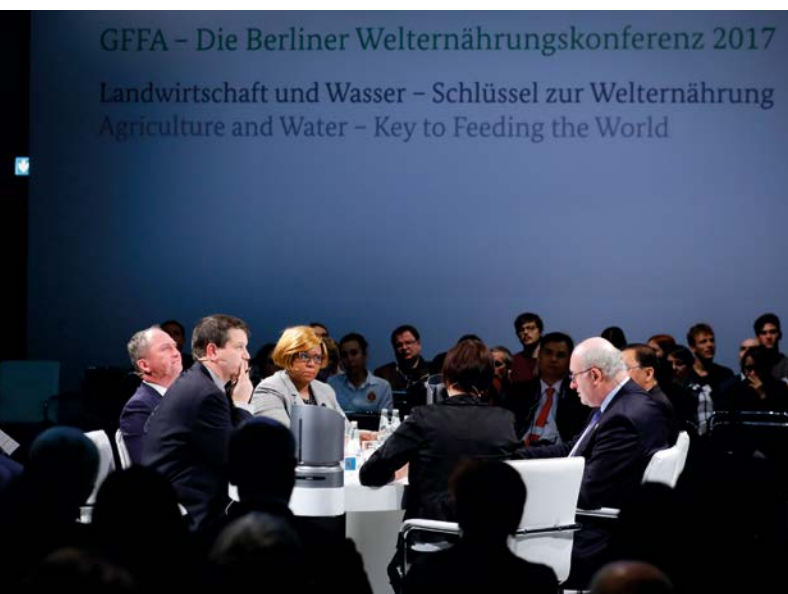
Impressionen aus den High Level Panels

Bei den fast durchweg ausgebuchten Veranstaltungen konnten Panelisten der unterschiedlichsten Fachrichtungen ihre Perspektiven einbringen. Hier wurden beispielsweise die Vorteile einer wassersparenden Tröpfchenbewässerung genauso erläutert wie die Voraussetzungen, die erfüllt sein müssen, damit die Verwendung von Abwasser in der Landwirtschaft gesundheitlich unbedenklich ist und auch bei allen Beteiligten Akzeptanz findet. Es wurde immer wieder deutlich, wie sich mit intelligenten Wassermangementslösungen sowohl der Wasserverbrauch verringern als auch gleichzeitig die landwirtschaftlichen Erträge steigern lassen. Unter Verweis auf die Agenda 2030- Ziele im Wasser- und Agrarsektor sprachen sich die Teilnehmer für innovative Lösungsansätze aus, die die gesamte Wertschöpfungskette der Nahrungsmittelproduktion in den Blick nehmen, d.h. die Anbaugelände und -produkte, den Produktionsprozess und die Lieferkette.