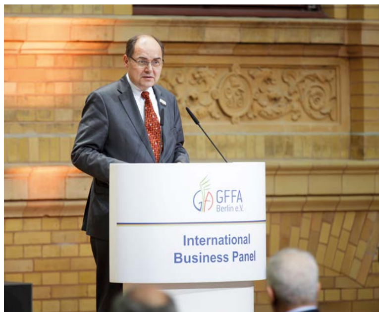
Landwirtschaftsminister Christian Schmidt

Die Rede des deutschen Landwirtschaftsministers Christian Schmidt markierte den Auftakt zu der Diskussionsveranstaltung. Minister Schmidt betonte, dass der Privatsektor und die Forschung eine besonders wichtige Rolle bei der weltweiten Hungerbekämpfung spielten. Ohne privatwirtschaftliche Investitionen im landwirtschaftlichen Sektor, so Schmidt, gebe es kein wirtschaftliches Wachstum und keinen Fortschritt. Es sei notwendig, Anreize für ein nachhaltiges und effizientes Wassermanagement der Landwirtschaft zu setzen. Auch müsse die Resilienz der Landwirtschaft gestärkt werden. Hier nehme die Forschung eine wichtige Rolle ein. So sei es wichtig, in die Entwicklung trockenresistenter Pflanzenarten zu investieren, damit die Erträge von Nahrungsmitteln bei weniger Wassereinsatz noch gesteigert werden könnten. Doch Schmidt ging auch auf globale Handlungsbeziehungen ein: So sollten Nahrungsmittel mit einem hohem Wasserbedarf nicht in Ländern mit hoher Wasserknappheit produziert werden.