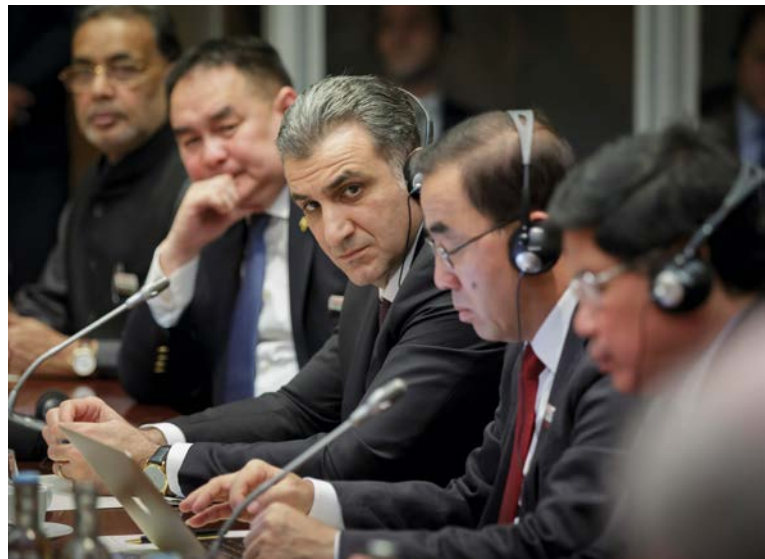
Die Landwirtschaftsminister bei den Beratungen in den Breakout-Sessions

Für die EU-Kommission stellte Agrarkommissar Phil Hogan fest, dass Wasser ein Menschenrecht, zugleich aber auch eine Grundvoraussetzung für die Herstellung von Nahrungsmitteln sei. Verlässliche Lieferketten für Lebensmittel bräuchten daher intelligente und nachhaltige Wasserstrategien. In dieser Hinsicht bestünde derzeit noch Nachholbedarf, auch wenn das nötige Know-how bereits vorhanden sei. Deshalb sei das zu verabschiedende Abschlusskommuniqué ein wichtiger weiterer Schritt.