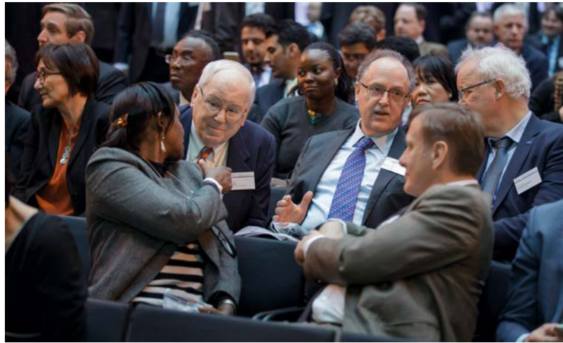
Das Publikum des Internationalen Wirtschaftspodiums