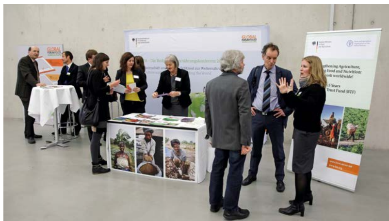
Informationsaustausch am Stand des BMEL zum Bilateralen Treuhandfonds (BTF)

Parallel zur Auftaktveranstaltung stellte das BMEL an einem Informationsstand sein konkretes Engagement im Bereich Wasser und Landwirtschaft vor: Mit Informationsbroschüren und im direkten Austausch mit Mitarbeitern konnten sich die Besucher über die vielfältigen Projekte informieren, die das BMEL korrespondierend zu den jeweiligen GFFA-Themen der vergangenen Jahre fördert. Mit diesen Projekten wird deutlich, dass zentralen Themen des GFFA nicht in der theoretischen Diskussion verbleiben, sondern mit dem sogenannten „Bilateralen Treuhandfonds“ direkt „auf dem Feld“ verankert werden. Der „Bilaterale Treuhandfonds“ ist ein Programm von BMEL und FAO, bei dem ausgewählte Projekte zur Ernährungssicherung in verschiedenen Ländern durchgeführt werden. Hier werden die GFFA-Themen auf die operative Ebene reflektiert und in konkreten Projekten umgesetzt. Die FAO leistet dabei die programmatische Durchführung, das BMEL das finanzielle Fundament. Seit 2002 konnten damit rund 100 Projekte mit einem Gesamtvolumen von rund 121 Millionen Euro realisiert werden.