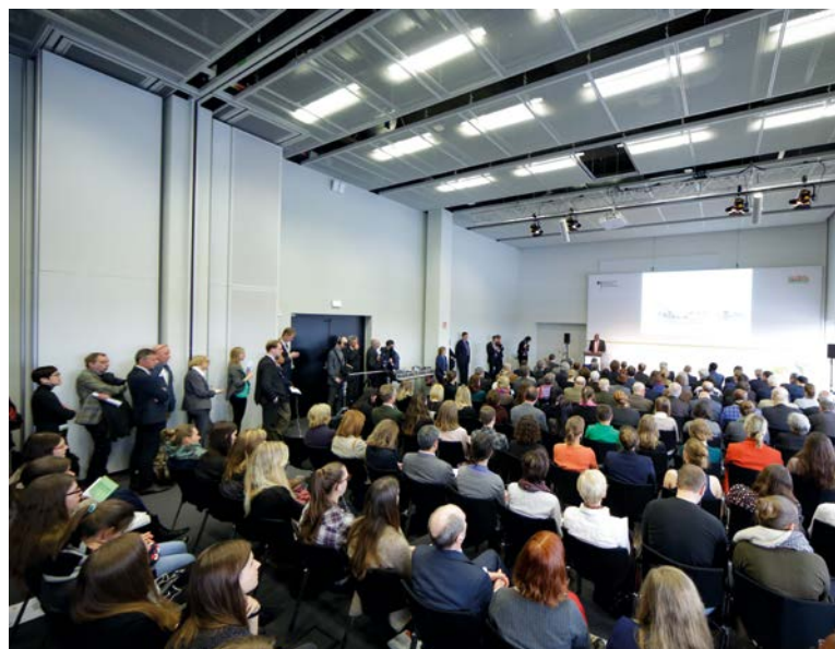
Vollbesetzte Reihen in den Fachpodien