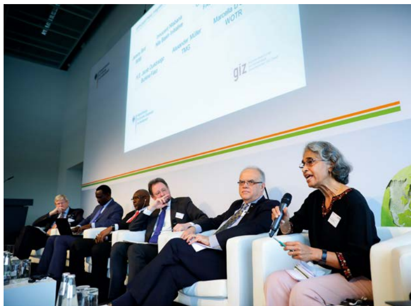
Podiumsdiskussion eines Fachpodienveranstalters

Die Ergebnisse der High Level Panels wurden von der EU-Kommission und der FAO in die 9. Berliner Agrarministerkonferenz eingebracht und flossen in das GFFA-Abschlusskommuniqué ein.