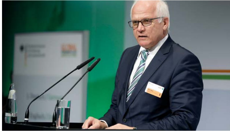
Peter Bleser, Parlamentarischer Staatssekretär beim Bundesminister für Ernährung und Landwirtschaft

In diesem Zusammenhang wies Bleser auf die zunehmende Wasserknappheit hin und bezeichnete den schonenden Umgang mit dieser Ressource als eine der zentralen Herausforderungen des 21. Jahrhunderts. Da-