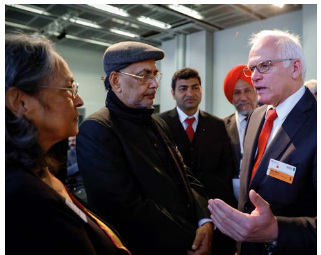
Peter Bleser, Parlamentarischer Staatssekretär im BMEL (rechts) beim Rundgang durch die Kooperationsbörse

Auf dem anschließenden Rundgang über die Kooperationsbörse kam Bleser mit den Ausstellern ins Gespräch und informierte sich aus erster Hand über deren Angebote und Projekte. Aussteller und Besucher hatten in diesem Jahr erstmals die Möglichkeit, zusätzlich auch im