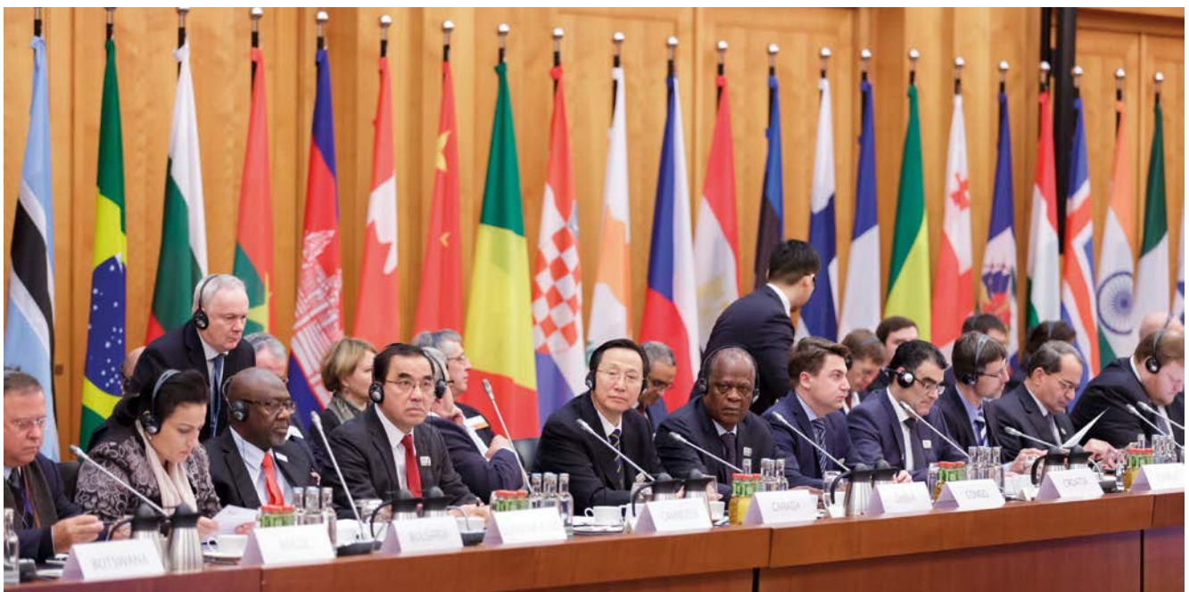
Die Teilnehmer der Berliner Agrarministerkonferenz 2017 im Weltaal

Aus der Breakout-Session zum Thema Wasserknappheit berichtete deren Vorsitzende, die sambische Landwirtschaftsministerin Dora Siliya , anschließend, man sei sich einig gewesen, dass zur Bekämpfung von Wasserknappheit insbesondere in die Wasserinfrastruktur, d.h. Wasserleitungen und –speicher investiert werden müsse. Des Weiteren sei für eine effiziente Wassernutzung eine Verringerung von Wassersubventionen für die Landwirtschaft und eine geeignete Form von Bepreisung des Wasserverbrauchs erforderlich. Der Kultivierung von Nutzpflanzen müsse wassersparender erfolgen, u.a. indem Wasserverluste durch Verdunstung verringert würden. Gerade Kleinbauern müssten wassersparende Produktionsmethoden in stärkerem Maße vermittelt werden. Forschung und Entwicklung müssten weiter an Techniken arbeiten, wie mit weniger Wasser mehr produziert werden könne. Und schließlich müsse im Zusammenhang mit den Nutzungskonkurrenzen sichergestellt werden, dass im Interesse einer ausreichenden Versorgung der Bevölkerung mit Lebensmitteln die Landwirtschaft einen vorrangigen Zugang zu Wasser erhalte.