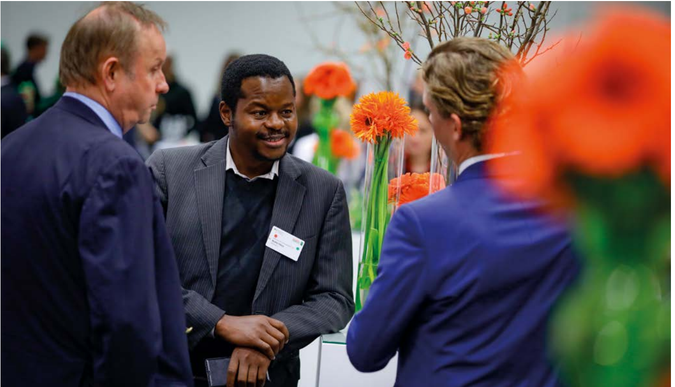
Besucher der Kooperationsbörse im Gespräch

Ein wichtiger Aspekt des GFFA ist das Networking. Diesem Ziel dient insbesondere auch die Kooperationsbörse: Sie bietet Unternehmen, Institutionen, Universitäten und Verbänden die Möglichkeit, ihre Projekte zu präsentieren und mit den Besuchern des GFFA ins Gespräch zu kommen. Auch in diesem Jahr nahmen wieder 30 Aussteller aus dem In- und Ausland an der Kooperationsbörse teil.