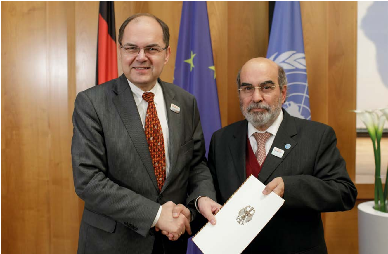
Bundesminister Schmidt (BMEL) und Generaldirektor der FAO José Graziano da Silva bei der Übergabe des Abschlusskommuniqués