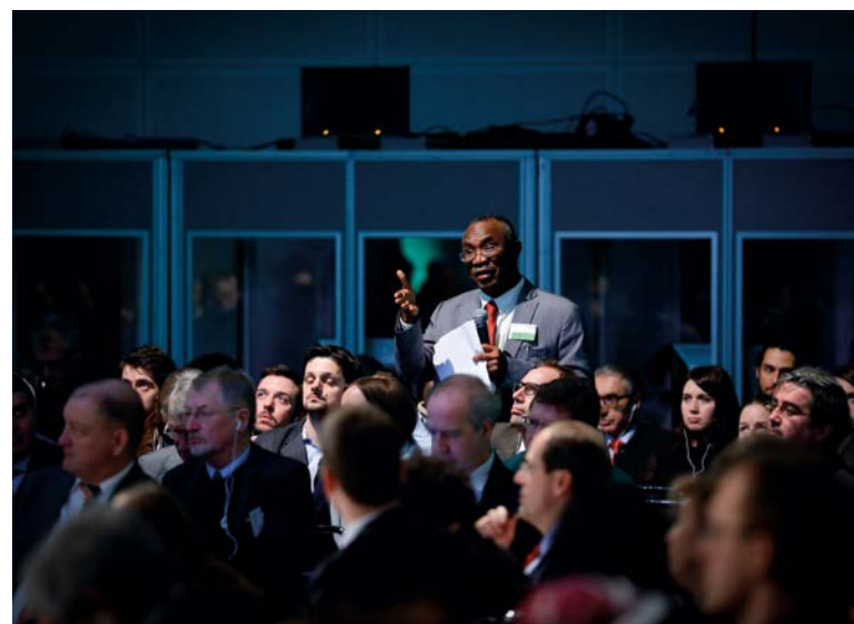
Interessierte Rückfragen aus dem Publikum