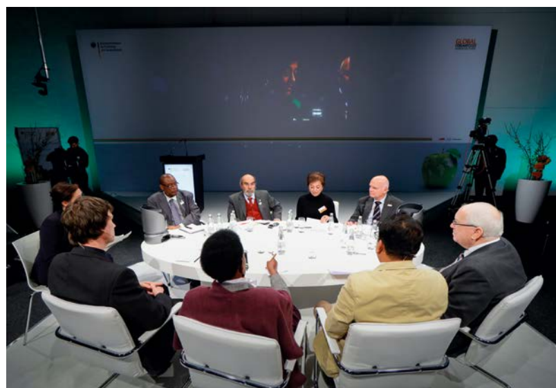
Die Podiumsteilnehmer des High Level Panels der FAO

Graziano da Silva stellte fest, dass man Dürren nicht verhindern, aber Vorsorge treffen könne, damit Dürren nicht zu Hungersnöten führten. Hierzu müsse die Landwirtschaft weniger Wasser verbrauchen und es effizienter einsetzen. Zugleich müssten Maßnahmen ergriffen