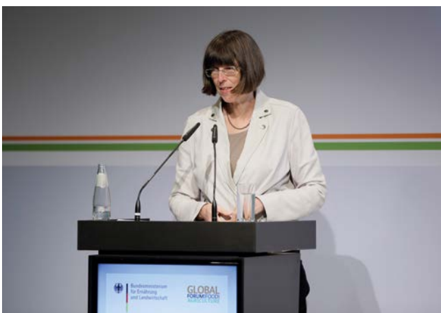
Margit Gottstein, Staatssekretärin der Senatsverwaltung für Justiz, Verbraucherschutz und Antidiskriminierung des Landes Berlin

Zugleich habe das Thema Landwirtschaft und Wasser eine globale Komponente, die auch Berlin besonders betreffe. Staatssekretärin Gottstein verwies in diesem Zusammenhang auf die große Zahl von Flüchtlingen, die nach Berlin kämen. Unter ihnen seien auch viele Klima- und Umweltflüchtlinge. Es bestehe deshalb ein großes gesellschaftliches und politisches Interesse, sich des Themas Wasser und Landwirtschaft im Sinne einer Prävention gegen große Wanderungsbewegungen anzunehmen.