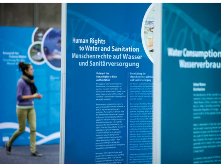
Wasserausstellung der UNESCO auf der Kooperationsbörse

Rahmen eines vom BMEL gegebenen Buffet-Mittagessens in den Räumen der Kooperationsbörse ins Gespräch zu kommen.