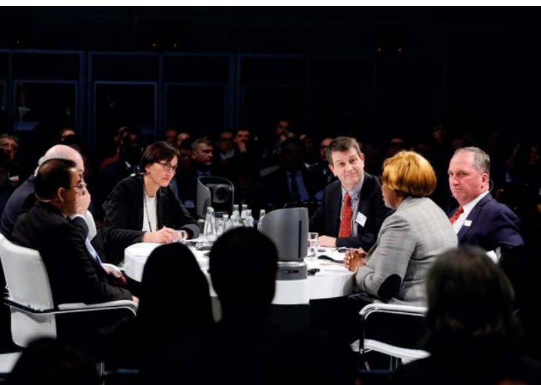
Podiumsdiskussion beim High Level Panel der Europäischen Kommission

Diese und weitere Maßnahmen müssen auf nationaler und lokaler Ebene in mittel- bis langfristigen Strategien integriert werden.