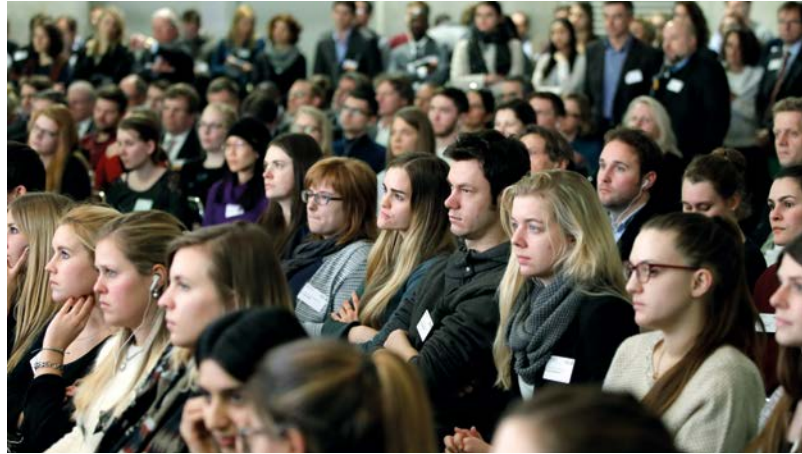
Das interessierte Publikum der Auftaktveranstaltung

den. Sie forderte, dabei auch die Bewahrung der Biodiversität im Blick zu behalten. Dazu müssten sich die Produktionsmethoden ändern. Frau de Souza sah in der Agrarökologie ein großes Potential, die Welternährung nachhaltig auch in Zukunft sicherzustellen.