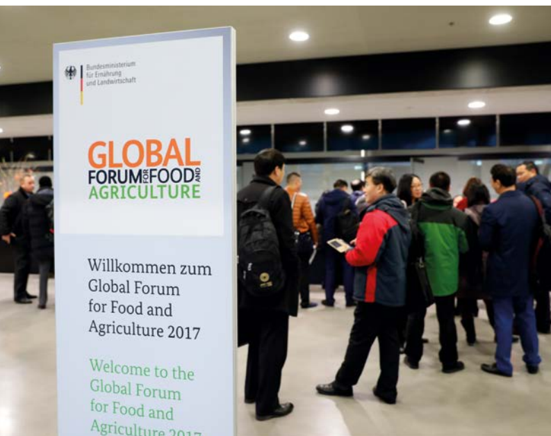
Foyer im City Cube

Das GFFA – Die Berliner Welternährungskonferenz ist eine internationale Konferenz zu zentralen Zukunftsfragen der globalen Land- und Ernährungswirtschaft und fand dieses Jahr zum neunten Mal während der Internationalen Grünen Woche in Berlin statt. Das Forum bietet Politik, Wirtschaft, Wissenschaft und Zivilgesellschaft Gelegenheit, sich über ein aktuelles agrarpolitisches Thema im Kontext der Ernährungssicherung auszutauschen und auf politische Eckpunkte zu verständigen. Das GFFA wird vom Bundesministerium für Ernährung und Landwirtschaft (BMEL) in Kooperation mit dem GFFA Berlin e. V., dem Senat von Berlin und der Messe Berlin GmbH veranstaltet.