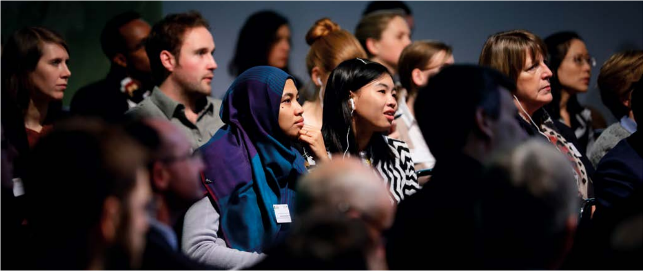
Blick ins Publikum

Sowohl von den Panelisten als auch den Diskussions- teilnehmern aus dem Publikum wurde betont, dass alle Beteiligten, so die politischen Entscheidungsträger, Wirtschaftsbeteiligte, Wissenschaftler, Vertreter der Zivilgesellschaft, gleichermaßen eingebunden werden müssen, um den Herausforderungen schwindender Was- serressourcen besser begegnen zu können. Landwirt- schaft und Wasser seien zwei Themen, die Hand in Hand miteinander gingen. Denken in vorgefertigten Schemata müsse überwunden werden, damit sektorübergreifende Ansätze erfolgreich entwickelt und umgesetzt werden könnten.