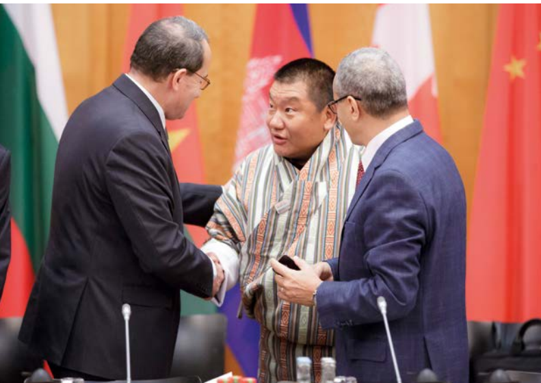
Teilnehmer der Berliner Agrarministerkonferenz 2017 im Gespräch

überproportional hoch. In diesem Zusammenhang wies sie darauf hin, dass nur eine nachhaltige Wassernutzung eine langfristige Ernährungssicherheit gewährleisten und die Versorgung der wachsenden Weltbevölkerung mit Lebensmitteln sei eine der wichtigsten Zukunftsaufgaben, vor der wir stehen.