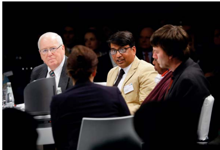
Blick auf die Diskussionsrunde des High Level Panels der FAO

In der Paneldiskussion berichtete der Landwirtschaftsminister von Sierra Leone, Monty Jones , von der Wasser-