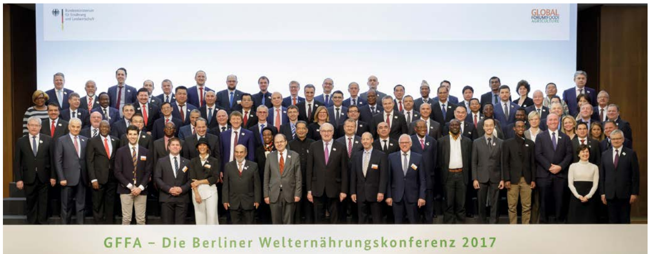
Teilnehmer der Berliner Agrarministerkonferenz 2017