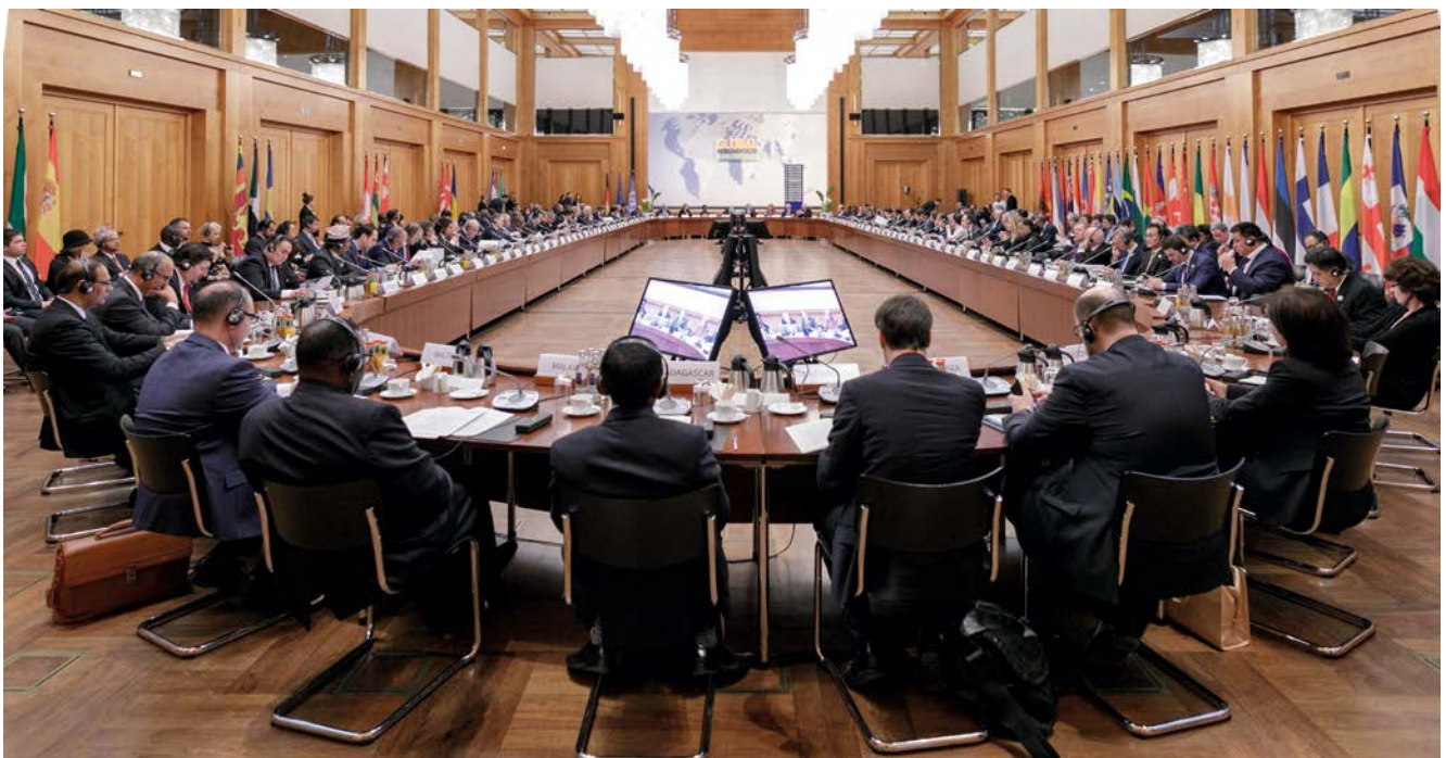
Die Berliner Agrarministerkonferenz 2017 im Weltsaal des Auswärtigen Amtes

In ihrem Grußwort erinnerte die Staatsministerin im Auswärtigen Amt, Maria Böhmer , an das Thema des GFFA 2016: Urbanisierung und Landwirtschaft. Durch die wachsende Verstädterung steige der weltweite Wasserbedarf und die Nutzungskonkurrenzen um Wasser. Gerade in den Ländern des Südens nehme die Urbanisierung stark zu, und hier sei auch die Wasserknappheit