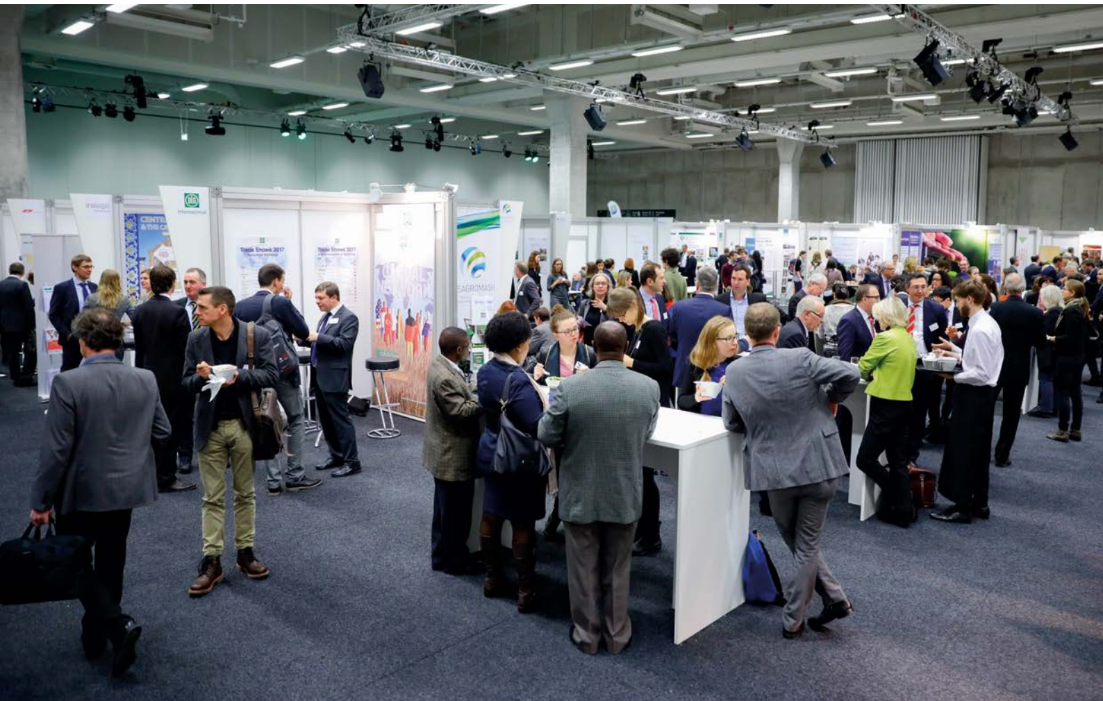
Die Kooperationsbörse 2017