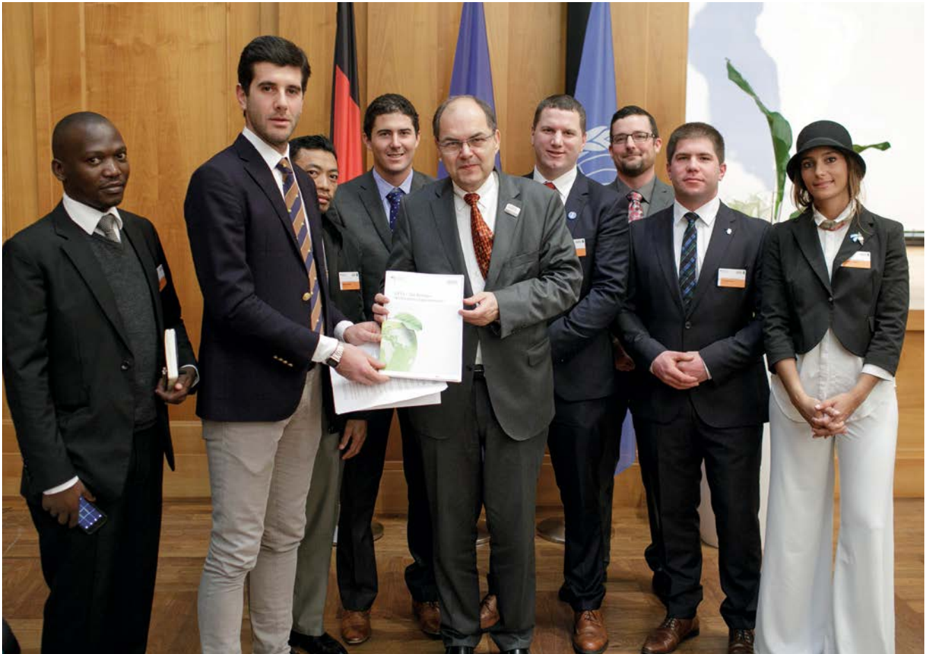
Die Junglandwirte mit dem Bundesminister für Ernährung und Landwirtschaft Schmidt bei der Berliner Agrarministerkonferenz 2017

Wasser verpflichten, aber auch von effektiveren Methoden der Reinigung und Speicherung von Wasser, um die nachhaltige Nutzung dieser Ressource zu ermöglichen. Die größte Bedeutung allerdings maßen sie einer offenen Kommunikation und dem effektiven Informations- und Wissensaustausch zwischen Verbrauchern, Politik, Wissenschaft, Landwirten und insbesondere auch der jungen Generation bei.