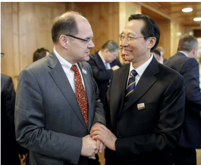
Bundesminister Schmidt begrüßt seinen chinesischen Amtskollegen Han Changfu

Die Breakout-Session zum Zugang zu Wasser wurde von Australiens Landwirtschaftsminister Barnaby Joyce geleitet. Als Ergebnisse der Beratungen stellte er dar, dass das nun als Sustainable Development Goal (SDG) formulierte Recht auf Wasser dabei helfen könne, einen nachhaltigen Zugang zu Wasser für Alle zu sichern. Dabei müsse allerdings der Lebensmittel-Wasser-Energie-Nexus beachtet werden: Das Erfordernis von 60 % mehr Lebensmitteln bis 2050 bedeute gleichzeitig eine um 50 % höhere Nachfrage nach Energie und um 55 % höhere Nachfrage nach Wasser. Besondere Bedeutung käme deshalb der Verwaltung und Steuerung der Wasserressourcen zu. Diese sei heute noch zu stark zersplittert, sowohl auf lokaler Ebene bis hinauf zur internationalen Ebene im Rahmen der UN. Es sei deshalb eine bessere Koordinierung erforderlich, auch zwischen den verschiedenen Sektoren (Landwirtschaft, Umwelt, Energie, Bergbau etc.) und länderübergreifend. Eine Schlüsselrolle nähmen effektive Institutionen ein, um einen nachhal-